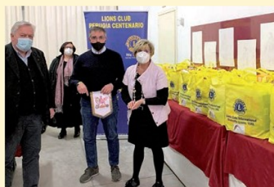
Un'immagine della consegna dei pacchi dono alle famiglie