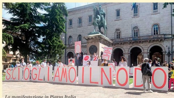
La manifestazione in Piazza Italia

Il 25 maggio è andata in scena una protesta davanti a Palazzo Cesaroni, al cospetto delle istituzioni regionali, per rafforzare il messaggio che la politica deve ascoltare la voce delle persone che amano il proprio territorio.