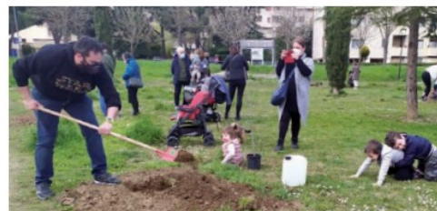
Alcune immagini del bel pomeriggio in cui sono state messe a dimora le piante nel Parco di via della Scuola