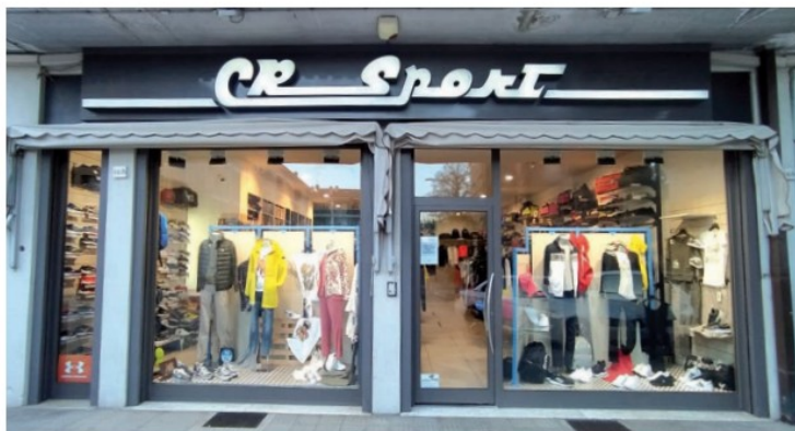
Le vetrine dell'attuale sede di CR Sport a Ponte San Giovanni

L'incremento del lavoro, merito di ambizione e professionalità, unito al continuo aumento di clientela, portano così la famiglia ad investire in moderni e funzionali macchinari per la produzione di munizioni. Ma il negozio diventa un importante punto di riferimento anche per gli amanti della pesca, al punto che molte società di pesca sportiva iniziano ad essere sponsorizzate