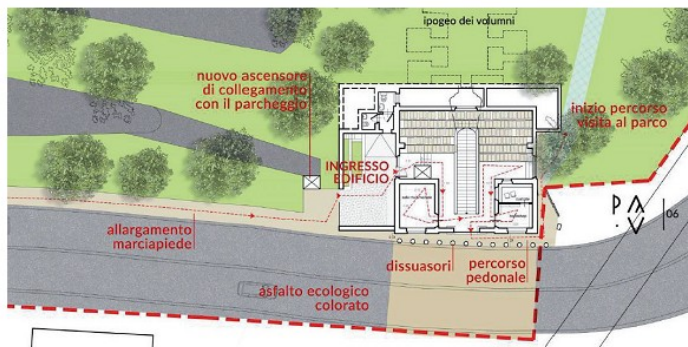
Valorizzazione dell'Ipogeo dei Volumni e dell'area verde della necropoli del Palazzone

Insomma, l'orizzonte sembra essere roseo, ma a togliere il condizionale dovrà essere la Commissione ministeriale. Non resta che incrociare le dita per vedere inserite le due proposte tra quelle ammissibili. Con Ponte San Giovanni che finalmente riuscirebbe a spiccare il volo.