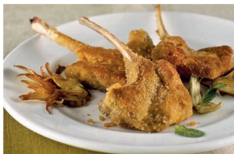
Costolette d'agnello fritte

Molti detti sono legati alla ricorrenza. Ad esempio, quando si giocava a bocchette