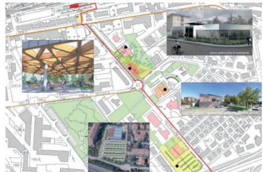
Riqualificazione dell'asse centrale di via Cestellini