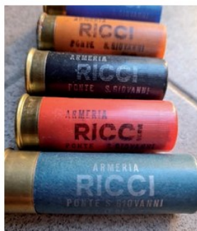
Le storiche cartucce dell'Armeria Ricci