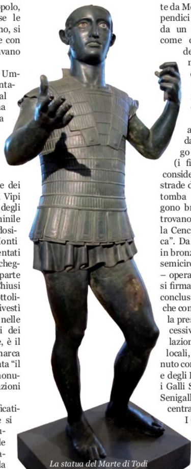
La statua del Marte di Todi

e reperti provenienti da Bratislava (centro del Norico) e, anche, materiali provenienti dal museo archeologico delle Marche, in quanto l'antica Umbria includeva quasi tutto il territorio delle attuali Marche. I Celti erano un popolo di guerrieri, ma anche di artigiani che avevano raggiunto una notevole qualità. Come si evince dai pezzi portati in mostra quali stateri a forma di conchiglia, dracme d'argento e tetradrammi, piastre d'oro. Tra i ritrovamenti di Chiusi, come Perugia, si erge nella parte vecchia in cima a un colle tra il fiume Moravia e il Danubio) anche una cassetta di bronzo con sigillo che testimonia relazioni diplomatiche con Roma ai tempi di Giulio Cesare; una campana in bronzo battuto, simile a quelle ritrovate ad Ercolano e Pompei; ambra proveniente dai paesi del Baltico; vetro del Medio Oriente; un pigmento raro come il blu egiziano; monete romane di epoca repubblicana e una moneta in argento con la scritta Apollonia Dyrachium, cioè Durazzo, la più antica città dell'Albania. I Celti, e quelli di Bratislava in particolare, si dimostrano altamente qualificati come forgiatori ed alcuni di loro persino autentici artisti.