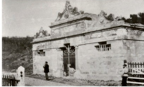
Una foto storica dell'Ipogeo dei Volumni

La "Pro Ponte" ha realizzato un video, sonorizzato in post produzione da chi scrive queste righe, sui lavori per la riproduzione artistica in