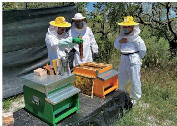
Alcuni soci della "Pro Ponte" a lezione di apicoltura

Insomma, con i tre alveari la "Pro Ponte", che ha come slogan "insieme per vivere" intende a modo suo dare alle api un aiuto per... vivere e per far continuare la vita nel mondo nella consapevolezza che questi insetti sono essenziali per il nostro pianeta, perché se la produzione del miele è importante, questo non è il solo motivo per salvaguardarle valendo la pena di considerare che in gioco c'è qualcosa di molto più grande e prezioso.