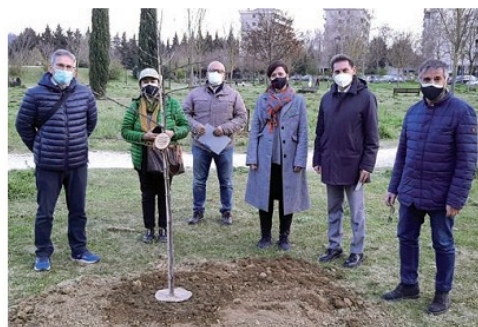
La cerimonia di consegna degli alberi intitolati ai neonati

La "Pro Ponte" poi, oltre che ai suoi volontari, ha potuto contare sulla generosa