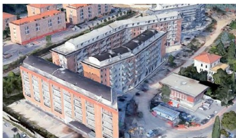
Una veduta aerea delle lottizzazioni che da anni sono incompiute

(per tutti "palazzoni") restando li abbandonati sembravano averla spuntata sull'esigenza di restituire quella zona alla comunità.