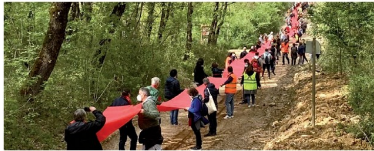
La manifestazione nel Bosco di Collestrada con il nastro che simula la cicatrice sul territorio

Vale la pena di mettere a rischio tutto ciò per un'opera inutile?