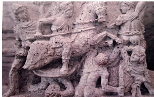
Un bassorilievo raffigurante la battaglia tra Etruschi e Celti

I Galli, che nella battaglia di Sentino (295 a.C.) contro i Romani furono alleati degli Umbri, degli