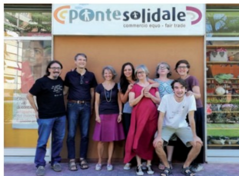
Lo staff del "Ponte Solidale"

Vi aspettiamo per poter costruire "un mondo migliore"