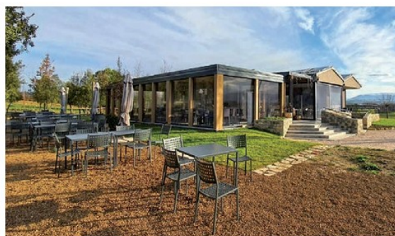
Veduta dello spazio esterno di "Flora Eat&Shop"

Il giovanissimo titolare Paride, accompagnato dal padre Eros, insieme alla madre Sabina e alla sorella Sofia portano avanti la loro missione: ridurre le persone al prodotto buono e genuino, senza bisogno di pesticidi o prodotti chimici di alcun tipo e natu-