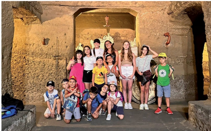
I ragazzi in attività durante le mattinate trascorse al "Centro Estivo Etrusco"