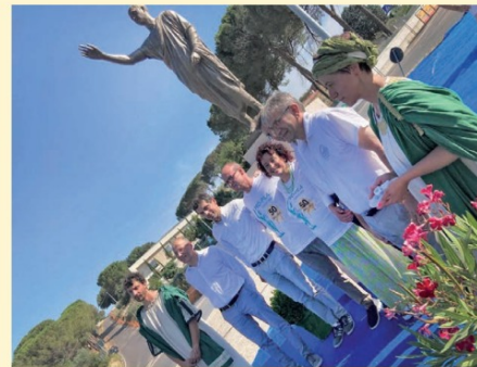
La delegazione della "Pro Ponte" presente alla messa in posa dell'Arringatore