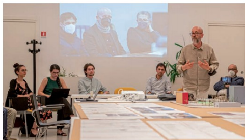
Al Centro civico “Euliste” la presentazione delle strategie concertate sotto il segno della maggiore qualità per verde e mobilità

di progettazione partecipata dei mesi precedenti nei tanti incontri tra cittadini e progettisti. Tutta la progettazione è stata focalizzata