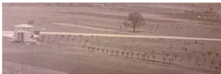
Il filare di gelsi bianchi che dalla Villa Sigismondi arrivava fino all'attuale Domauto (vicino alle Poste), lungo il Fosso della Getola. Anno 1952

che i nostri concittadini sappiano quanti tesori sono celati nel nostro paesaggio, aprendo gli occhi sui valori che rappresentano ancora le nostre radici. Per questo proponiamo la conoscenza del territorio e delle sue risorse come chiave per rendere più rispettoso lo sviluppo di ciò che verrà, sia del tessuto urbano che del tessuto sociale. E questo filare rappresenta anche un pezzo di quella storia che vogliamo tutelare e far conoscere, per meglio vivere il nostro futuro.