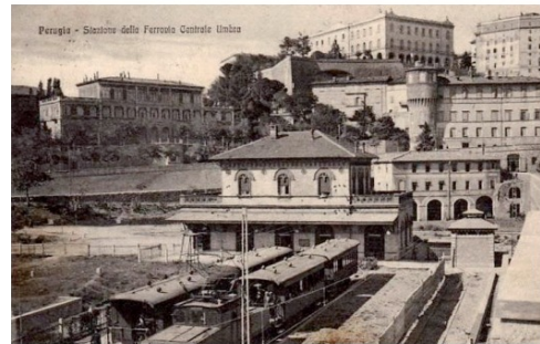
La stazione di Sant'Anna in una cartolina storica

Spreco di denaro, deturpazione del paesaggio e ritardi che aggravano la situazione di degrado ambientale, inquinamento acustico e atmosferico in cui convivono, soprattutto, gli abitanti di Ponte San Giovanni; forse, nel comunicato dell'assessore, questi ultimi sono stati indicati come "profeti di sventura" perché qualcuno si è permesso di obiettare sulla necessità del raddoppio dei binari in alcuni tratti e sulla eccessiva durata dei lavori con tanto di citazione che nello stesso periodo di tempo (cinque anni) tra il 1881 e il 1886 furono costruiti 5.975 km di binario tra Atlantico e Pacifico su territori canadesi e americani molto più impervi e accidentati rispetto ai 4 km circa da Ponte San Giovanni a Perugia Sant'Anna? Non è colpa di chi valuta se il rapporto, nel paragone citato, parla di più