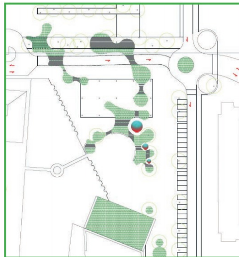
Il progetto visto dall'alto nell'area tra via della Scuola e via Cestellini

La “Pro Ponte”, dal canto suo, ha evidenziato l'im-