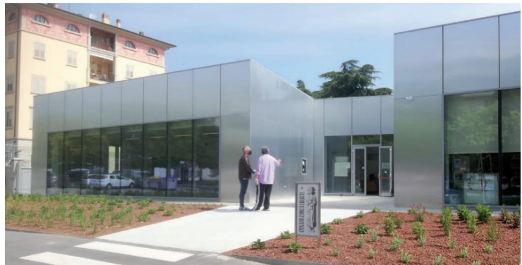
Il nuovo Centro civico costruito a fianco della caserma dei Carabinieri

L'idea originale era quella di dare al centro del paese un'anima e sostituire quel "piazzone senza logica e anche bruttino" in un centro cittadino! Questa visione, con fortuna ma anche con coraggio, sta vedendo il suo compimento, in seguito alla aggiudicazione dei fondi del "PIN-QuA", grazie al quale presto vedremo realizzata la completamento dell'idea.