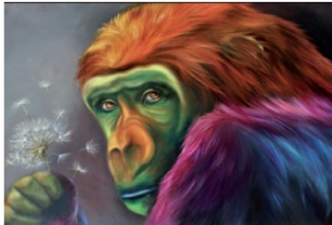
L'opera di Velloni "Ho creduto fosse neve"

Velloni, in cui animali ricoperti di pelurie multicolori si presentano in atteggiamenti semi-umani, secondo un linguaggio maturato in anni di pittura e indirizzato a una figurazione surreale, a tratti ironica, ma carica di struggente umanità.