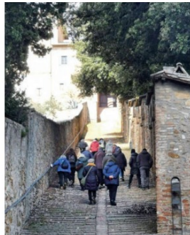
Visita al convento di Monteripido

E ancora: domenica 12 giugno una passeggiata a Perugia con partenza dall'Arco Etrusco fino all'Ipogeo dei Volumni e visita ai depositi della Necropoli del Palazzone; domenica 3 luglio gita a Chianciano e Sarteano per la visita dei rispettivi Musei e della tomba della "Quadriga infernale" alla Necropoli delle Pianacce. Giova ricordare che il Museo Civico Archeologico di Sarteano raccoglie i materiali provenienti dalle numerose necropoli etrusche del territorio comprese in un arco cronologico che va dal IX al I sec. a.C. La straordinaria tomba dipinta del IV sec. a.C. della Quadriga infernale, con scene legate all'immaginario ultraterreno, vede invece pro-