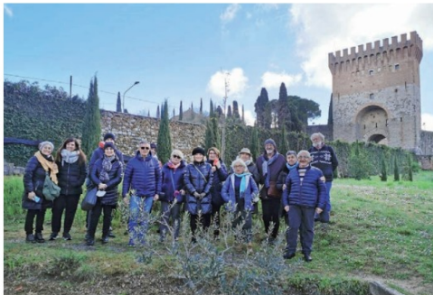
La "Pro Ponte" in visita al complesso di San Matteo degli Armeni